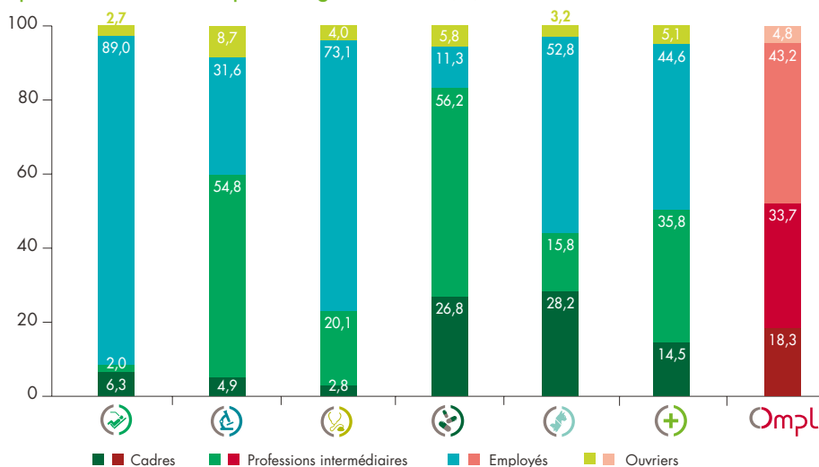
Répartition des salariés par catégorie sociale (%)